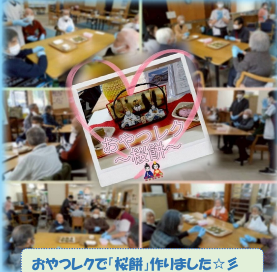
おやつレクで「桜餅」作りました☆彡