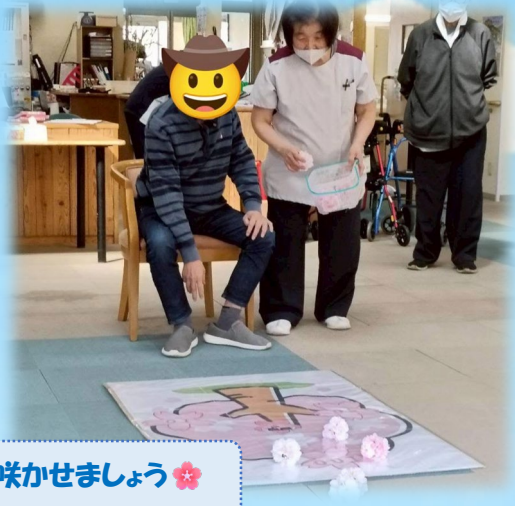
花を咲かせましょう🌸