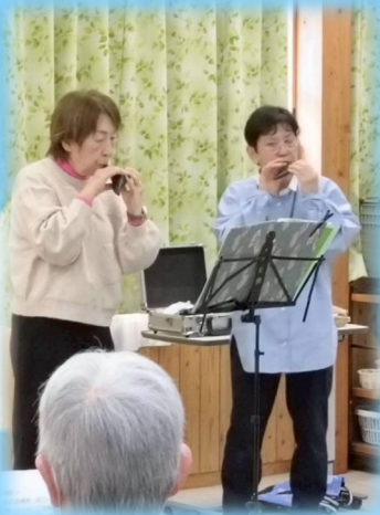
♪ オカケ演奏会 ♪