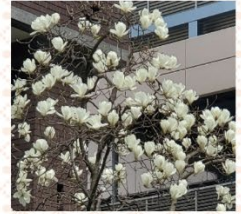
「春を告げる花 ハクモクレン（白木蓮）」