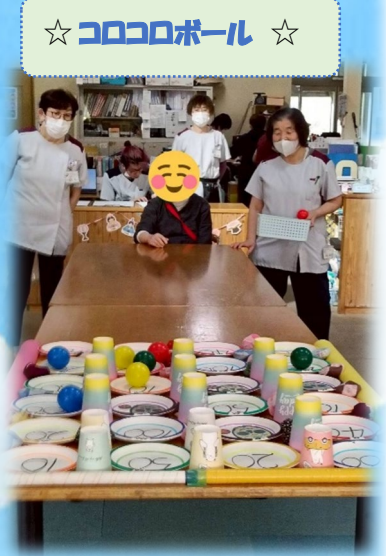
☆ コロコロボール ☆