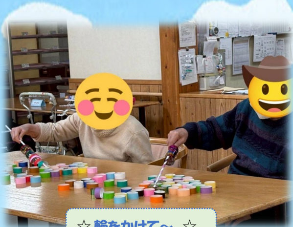
☆ 輪をかけて～ ☆