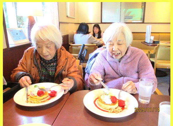
パンケーキ女子会 🍰

新年を迎えた看多機しまむらは、寒さに負けず、元気いっぱいにお過ごししました。初詣に出かけたり、おせち料理を食べたり、おみくじ、絵馬、福笑い、カルタ遊びをしてお正月を満喫しました。寒い冬にピッタリのあったかスイーツ、お汁粉を作ったり、デニーズでイチゴのパンケーキを食べる女子会もしました。暖かな春の陽気を楽しみにしつつ、体調管理に十分気を付けて、楽しく過ごして頂けるように努めてまいります。