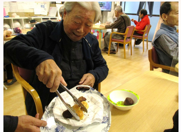
プチパンバイキング 🍞