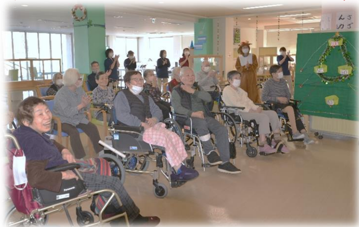
皆さんと手作したクリスマス会 楽しく過ごせましたか