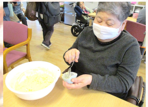
さつま芋蒸しパン 🍠

寒い日が続いていますが、暖かい日や時間を狙ってゆいの花公園にお出かけをしたり、買い物に出かけました。おやつイベントではみんなでさつま芋蒸しパンを作ったり、プチパンバイキングを行いました。レクリエーションとしては、ボウリング大会を行ったり、紙コップをすくい上げるゲームをして盛り上がりしました。冬でも看多機しまむらは元気いっぱいです。寒さも吹き飛ばすようなイベントやレクリエーションをたくさん企画していきます。楽しみにして頂けると幸いです。