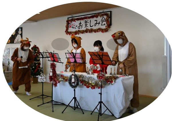
職員による クリスマスソングの演奏と歌 練習の成果は